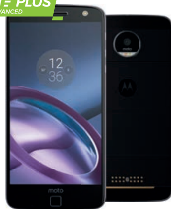
Lenovo Moto Z