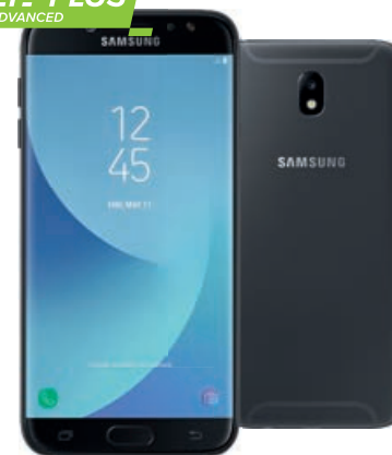
Samsung Galaxy J7 (2017) Dual SIM