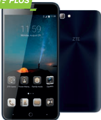
ZTE BLADE A612