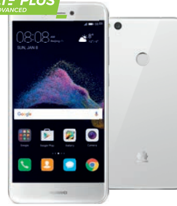
HUAWEI P9 Lite 2017