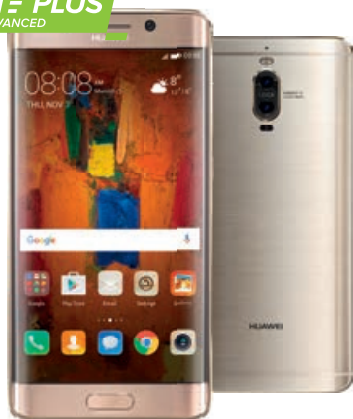
HUAWEI Mate 9 Pro