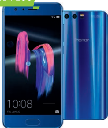
HUAWEI Honor 9