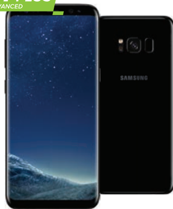
Samsung Galaxy S8+