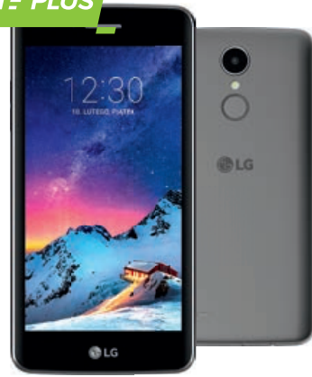
LG K8 (2017)