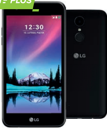
LG K4 (2017)