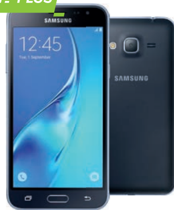
Samsung Galaxy J3 (2016)