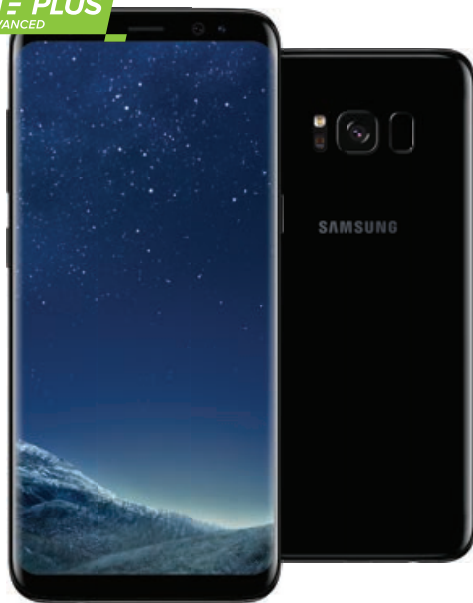
Samsung Galaxy S8

***** PONAD POŁOWA NAJWIĘKSZYCH FIRM KORZYSTA Z PLUSA *****