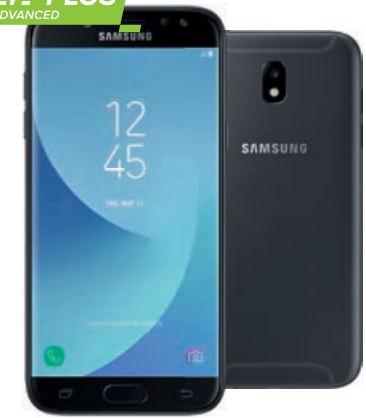
Samsung Galaxy J5 (2017) Dual SIM